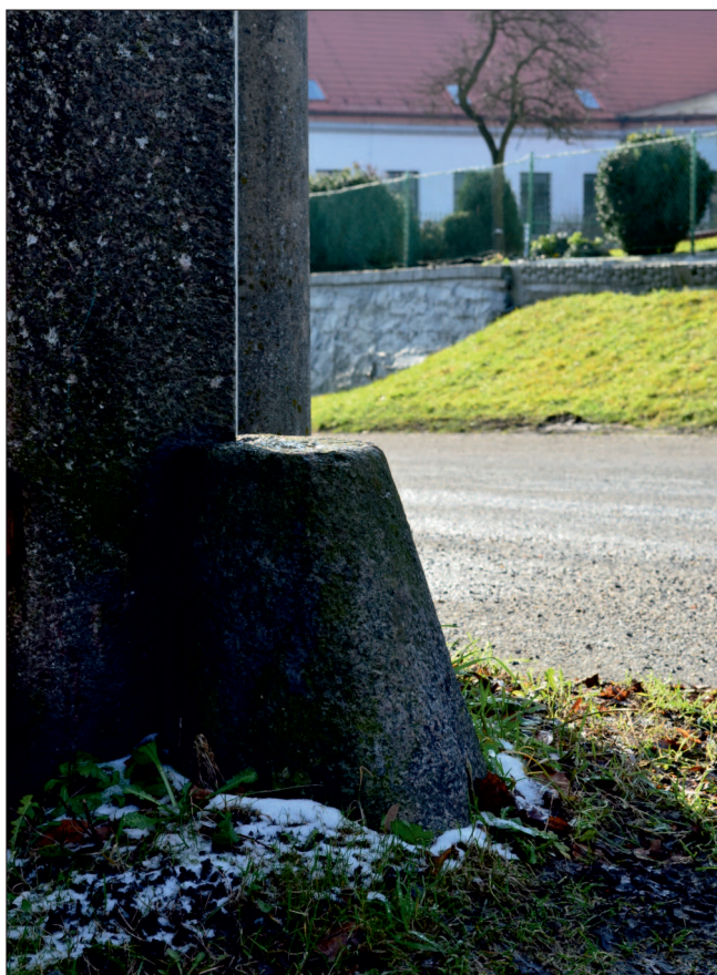
Nahoře: Detailní fotografie žulového „nárožáku“ u vjezdu do dvora u čp. 175 v Polní ulici. Vpravo: Celkový pohled na vjezdovou bránu.

Krásný a velice zachovalý pár odrazových kamenů se v Chrastavě nachází např. u brány při vjezdu do dnešního zdravotního střediska v Polní ulici, dům čp. 175. Jsou to pravděpodobně nejmladší objekty sloužící k tomuto účelu umístěné v Chrastavě. Usuzuji tak proto, že stavba tzv. Bezirks-Krankenkasse (tedy Oblastní zdravotní pojišťovny), byla na kraji tehdejší Meierhofweg postavena až v roce 1924. A to včetně žulové podezdívky a sloupů plotu kolem objektu a již zmíněné vjezdní brány, jejíž součástí jsou.