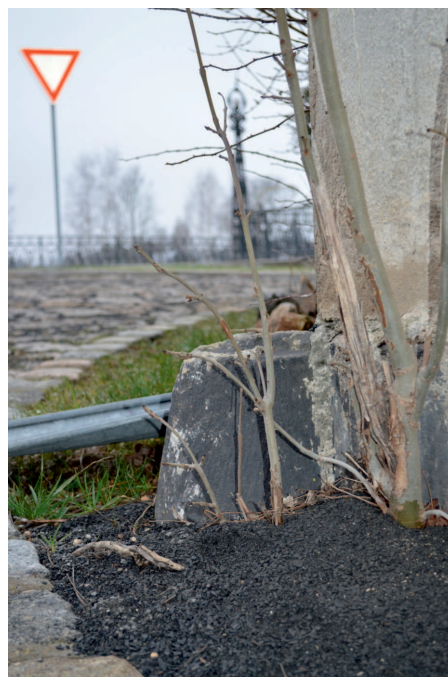
Nárožní kámen u čp. 106 Mlýnská ulice, pískovec. Foto: I. Vydra, 2014