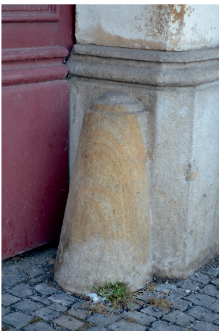
Párový nárožní kámen ochraňující vjezd do domu čp. na náměstí 1. máje, pískovec.