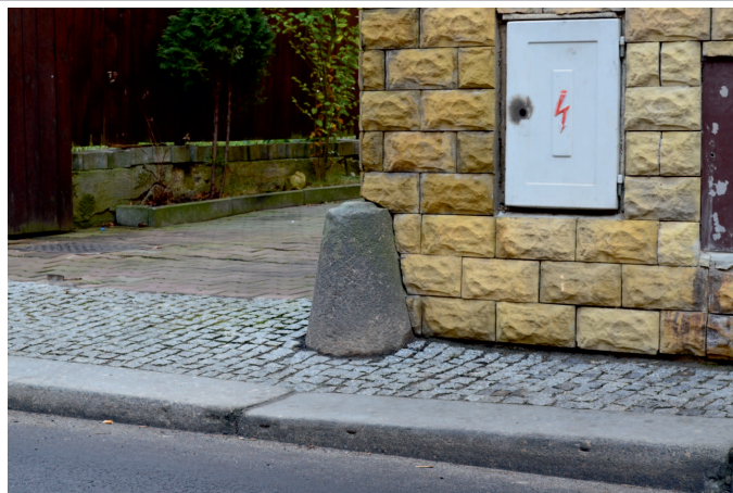
Vjezd k domu – Žitavská čp. 354, pískovec.