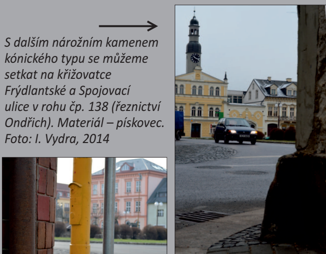
S dalším nárožním kamenem kónického typu se můžeme setkat na křižovatce Frýdlantské a Spojovací ulice v rohu čp. 138 (řeznictví Ondřich). Materiál – pískovec.