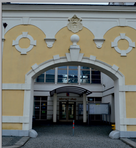
Stejný typ nárožních kamenů při vjezdu do bývalého dvora radnice čp. 1. Tyto kameny se dodnes zachovaly ve výborném stavu.