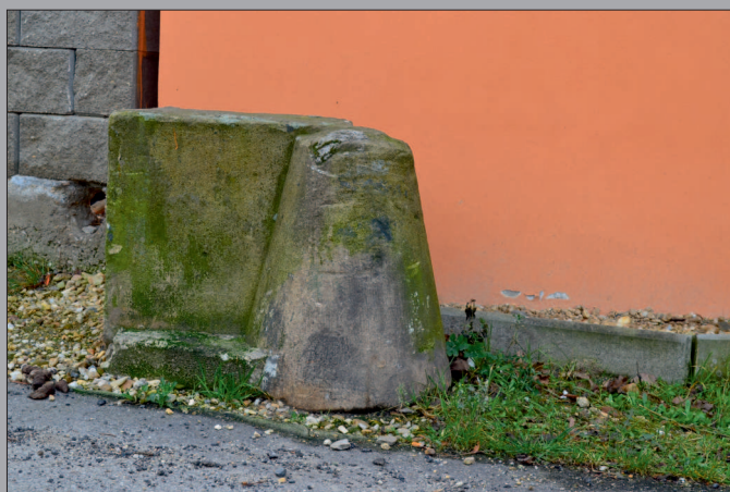
Nárožní kámen u čp. 93 v Mlýnské ulici (v jihovýchodním rohu parku u Führichova domu) je zástupcem typu vloženého do rohových základů domu. Tento byl vyňat z původního domu, který zde donedávna stál, a dnes je volně před novým domem. Materiál – pískovec.