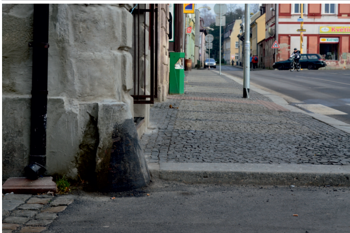
Náměstí 1. máje čp. 144, pískovec. Foto: I. Vydra, 2014