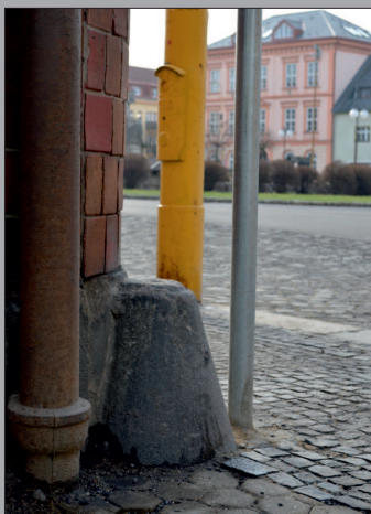
Nárožní kámen na křižovatce náměstí, Spojovací a Frýdlantské. Je součástí domu čp. 50 (květinářství). Materiál – žula.