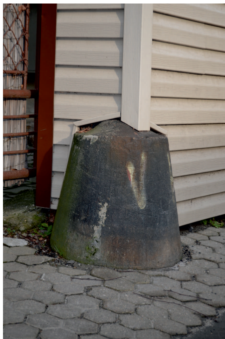
Vjezd k domu – Frýdlantská čp. 476, pískovec. Foto: I. Vydra, 2014