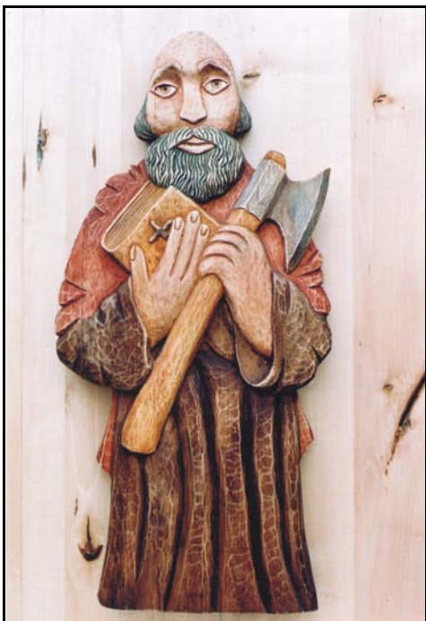
Jeden z apoštolů orloje v Kryštofově Údolí.