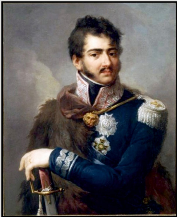
Princ Józef Antoni Poniatowsky - generál, velitel polského spojeneckého vojska.