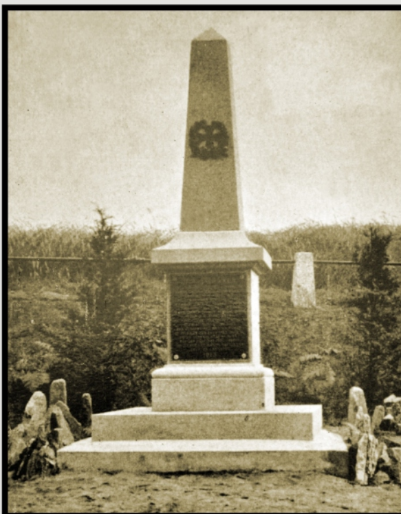
Původní stav a místo pomníku po odhalení v roce 1913.