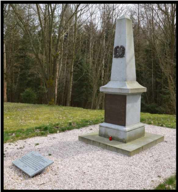
Kunratický válečný pomník po rekonstrukci v roce 2013 (sto let od jeho slavnostního odhalení). Stav květen 2016, foto: Ivan Vydra