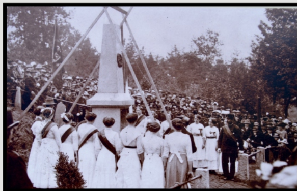
Slavnostní odhalení pomníku u Kunratic dne 3. 8. 1913.